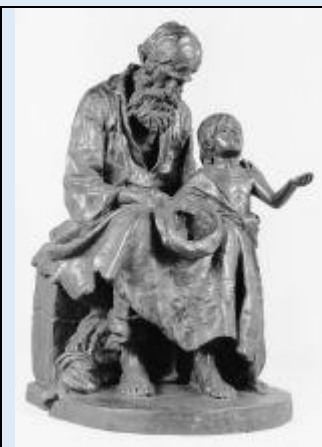
Alojz Repič: Slepí berač z dečkom