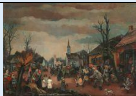
France Mihelič: Pustovanje na Ptujskem polju