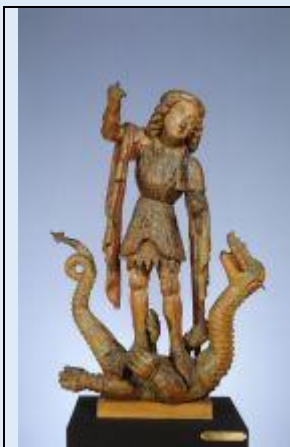
Neznani avtor: Sveti Jurij