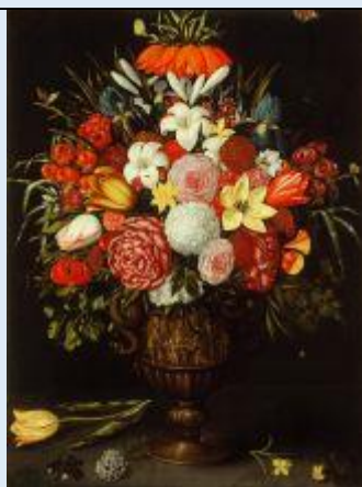
Neznani avtor: Vaza s cvetjem