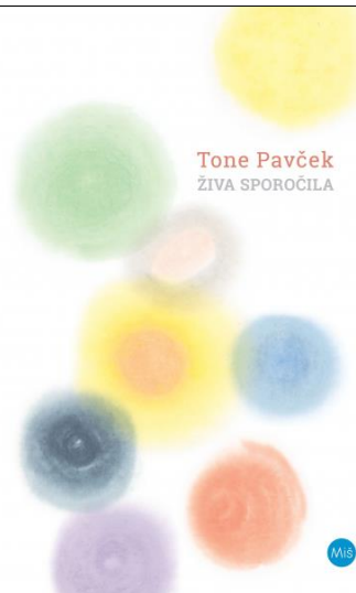
Tone Pavček: Živa sporočila . Ilustriral Andrej Brumen Čop; [sprema beseda Igor Saksida, Miroslav Košuta]. (Miš založba, 2021), 158 str. | poezija za odrasle