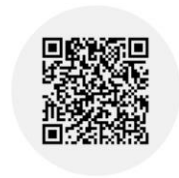
Tavola rotonda (11.45-12.30) Il superpotere delle biblioteche

La rete delle biblioteche slovene offre un'ampia gamma di libri in tutta la Slovenia. Il dibattito della tavola rotonda si concentrerà sul contributo dei bibliotecari che pianificano, organizzano e implementano programmi bibliotecari in vari tipi di biblioteche in base alle diverse esigenze degli utenti. Inoltre, ci si soffermerà anche sulla funzione connettiva delle biblioteche e si rivelerà la formula che si nasconde dietro il superpotere delle biblioteche.